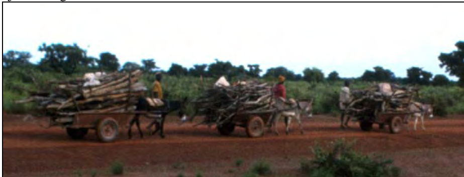
Een constante stroom van brandhout verdwijnt naar de stad.

De geschiedenis van Bud Senegal had op dat moment weinig met ons scholenbouw werk te maken, maar was een voorbeeld van gebrek aan kennis of geen aandacht voor de milieu problemen, en kapitalistisch winstbejag van zowel de ambtenaren als de compagnie. "Na mij de zondvloed", of beter gezegd: ... de woestijn. Immers de overheid werd betaald voor het gebruik van het land, een aardige som geld waar weer een aantal ambtenaren van gefinancierd werd. In latere jaren zou er voor ontwikkelingsprojecten een milieu effect rapportage gemaakt moeten worden, maar toen was dat allemaal niet nodig. Bovendien was het een commerciële operatie, geen ontwikkelingshulp. In dit geval is men in Senegal misschien door de opgelopen milieuschade wijzer van geworden.