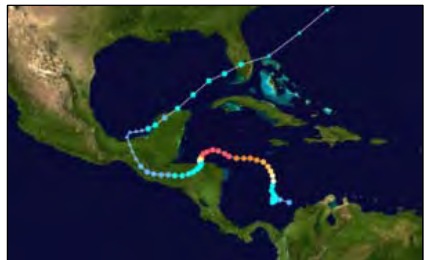
Internetplaatje van de route van de orkaan Mitch.

De orkaan Mitch heeft in oktober 1998 zowat alle rurale settlements die we in 1980 hadden ontwikkeld letterlijk weggevaagd. Dit geeft aan dat je op micro niveau wel een resultaat kan bereiken, maar dat op mondiaal niveau het maar betrekkelijk is als daar de situatie veranderd. Die grote orkaan had te maken met de klimaat- en milieu problemen waarbij de wereld energie consumptie en de hoge CO 2 uitstoot een hele belangrijke factor is. Constante ontbossing in Centraal en Zuid Amerika, speciaal in de Amazone regio lijkt ook sterk te maken te hebben met de groei van de grootte en het aantal van de orkanen in het Caribische gebied.