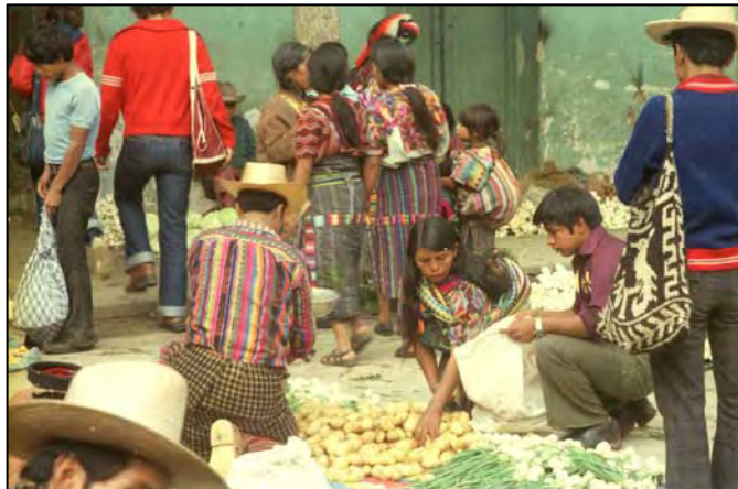
Markt in Guatemala

Met de hoge olieprijs van de jaren 2000 en daarna ging het land bijna failliet aan de hoge subsidies op elektriciteit, maar die subsidies op korte termijn verminderen zou een burgeroorlog betekenen. Ondernemers die gespecialiseerd waren in het installeren van hydro-elektrische installaties ondervonden met hun plannen grote weerstand van de campesinos om in de vele valleien nieuwe dammen of conduits voor hydro-elektrische installaties te plaatsen. Dat had alles te maken met hun "commerciële" werkmethode. Niet alleen raakten die campesinos hun land kwijt, maar als onderdeel van deze werkmethode van de industriëlen werden ze nauwelijks gecompenseerd, en kregen ze niet eens zelf toegang tot de gegenereerde elektriciteit. Alle elektra moest aan de elektra maatschappij geleverd worden en met minimale quota. Het argument van de ondernemers was dat de overheid te lage tarieven betaalde voor de geleverde elektriciteit, tenzij die ondernemers ook zelf topfunctionaris waren bij de overheid. Een resultaat was dat er sinds 1980 nauwelijks nieuwe hydro-elektrische installaties werden gebouwd, dus helemaal niet zo commercieel.