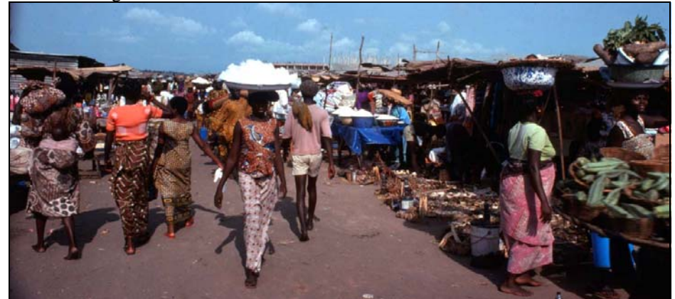
Markt in de snel groeiende urbanisaties van west Afrika.

feite ook zo, maar dat mocht niet gezien worden. Met internationale ontwikkelingshulp financiering waren er paar Nederlandse deskundigen betrokken bij het uitwerken van oplossingen die varieerde van het planten van bomen (uit het zicht) tot structurele wijk verbeteringsplannen (goed voor de bevolking). Zij produceerde een erg interessante studie over Parcelles Assainies waaruit ik later veel informatie opdiepte over stedelijke ontwikkeling in Afrika, en die mij goed van pas kwam. De overheid wilde een snelle en afdoende oplossing. Met de gaande rurale exodus en grote urbane groei zou een langzame maar definitieve oplossing in samenwerking met de bevolking slechts achter de ontwikkelingen aanlopen. Uiteindelijk werd het een muur, want alle andere plannen duurde te lang of waren niet afdoende. Die bomen kon je dan altijd nog voor die muur planten, maar een hoge muur loste ook het probleem van de overstekende voetgangers op. De bomen zijn er bij mijn weten nooit gekomen.