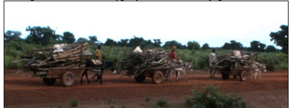
Een constante stroom van brandhout verdwijnt naar de stad.

De geschiedenis van Bud Senegal had op dat moment weinig met ons scholenbouw werk te maken, maar was een voorbeeld van gebrek aan kennis of geen aandacht voor de milieu problemen, en kapitalistisch winstbejag van zowel de ambtenaren als de compagnie. "Na mij de zondvloed", of beter gezegd: ... de woestijn. Immers de overheid werd betaald voor het gebruik van het land, een aardige som geld waar weer een aantal ambtenaren van gefinancierd werd. In latere jaren zou er voor ontwikkelingsprojecten een milieu effect rapportage gemaakt moeten worden, maar toen was dat allemaal niet nodig. Bovendien was het een commerciële operatie. In dit geval is men in Senegal misschien door de opgelopen milieuschade wijs geworden.