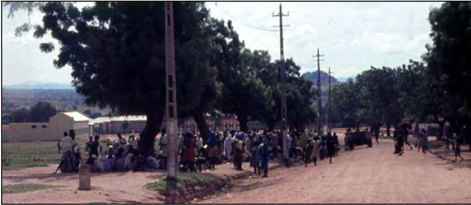
Een van de hoofdwegen bij Juba. Onder de bomen in de schaduw was er wat markt van groente en soms gedroogde of verse vis uit de rivier.

gemobiliseerd worden om een pakketje op de boot naar Kenia te zetten. Op de terugweg in het vliegtuig nog wat tijdsplanning en budgetplanning gemaakt, en overlegd wat de snelste manier was om die brug daar neer te leggen. Het zou niet meer dan een miljoen kosten met alles er op en er aan. Zo ging dat anno 1972.