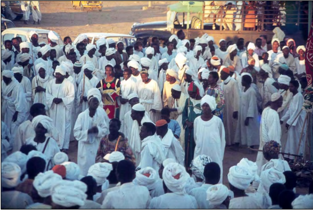
Op straat zijn bijna alleen maar mannen in djellabas.