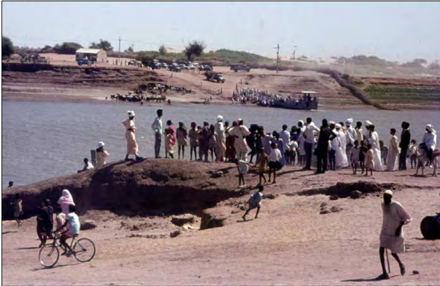
De langzaam stromende en brede Witte Nijl bij Juba met een klein veerpontje waar slechts een personenauto tegelijk op kon.

Wat zijn die mensen zwart hier, een heel stuk zwarter dan in het noorden van de Soedan of in Zambia. En zoveel zon op het lichte zand dat het pijn doet aan je ogen, zelfs met een zonnebril is het nauwelijks te harden; natuurlijk ook omdat we net in de donkere ruimte van het vliegtuig hebben gezeten. De verschillen met het noorden en Khartoem zijn een veelvoud. De twee regio's hebben nauwelijks iets gemeen. Het land is vlak, kaal en uitgestrekt, Juba is een dorpje van niks met hier en daar een gebouwtje of een halve ruïne, de tekenen van jarenlange oorlog en verwaarlozing zijn duidelijk zichtbaar. Langs de kant van de weg zitten onder een rij mangobomen een groep verkopers van cassave, groentes, zeep, gedroogde vis en hulpgoederen; een markt kan je het nauwelijks noemen.