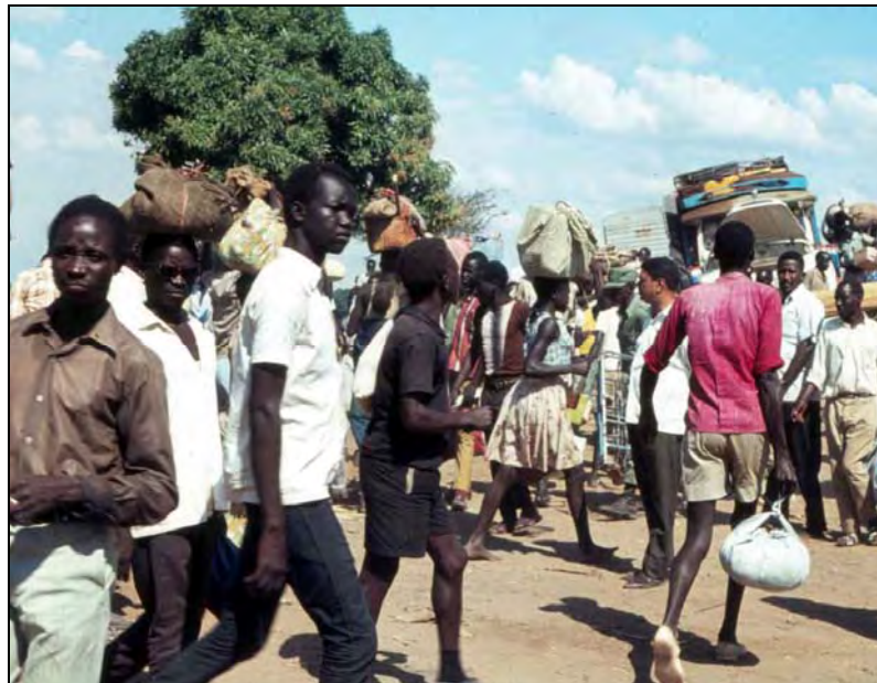
Bij de markt in Juba, een ander volk dan in Khartoum