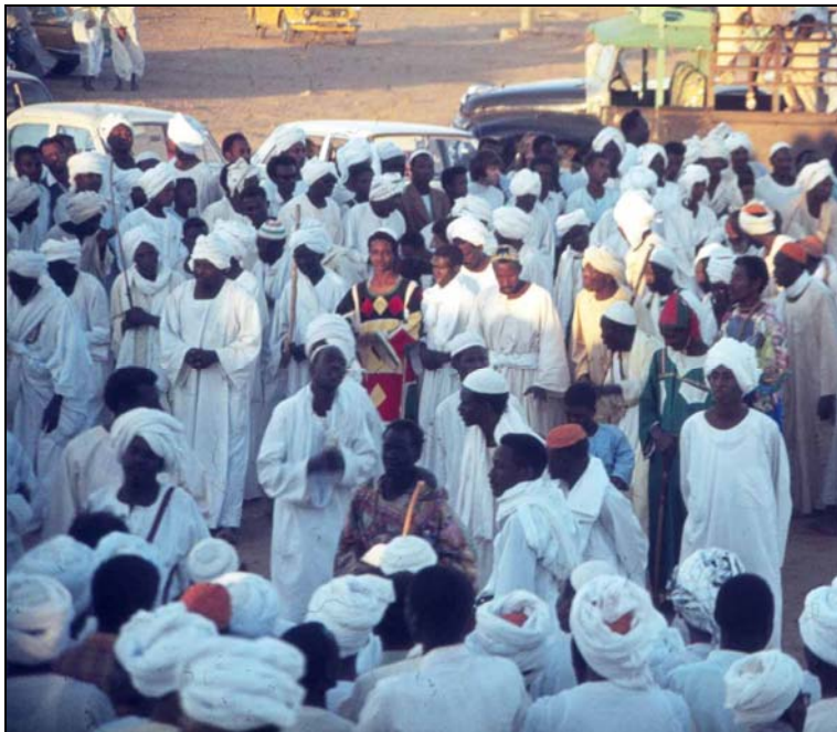
Op straat zijn bijna alleen maar mannen in djellabas.